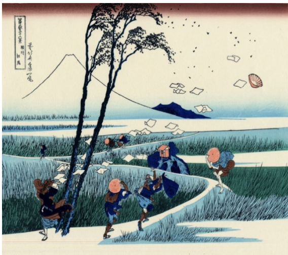
葛飾北齋(Katsushika Hokusai)，《富嶽三十六景—駿州江尻》，1831年，設色木板畫，26 x 38.5 cm (150字以上)