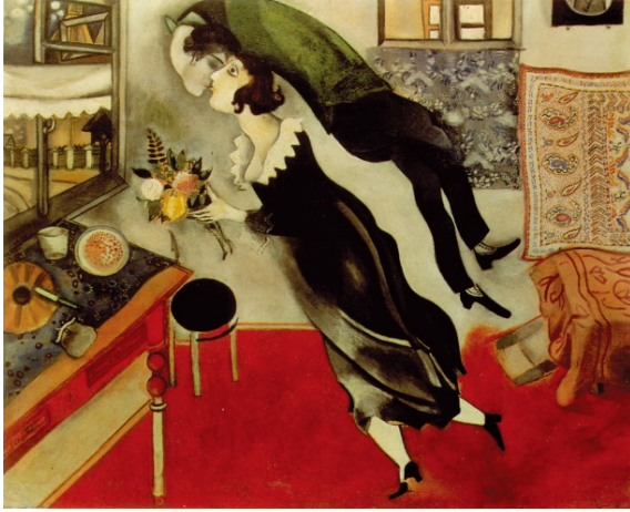
夏卡爾(Chagall Marc 1887-1995)，《生日》(The Birthday)，1915年，畫布油彩 80.6×99.7 cm (150字以上)